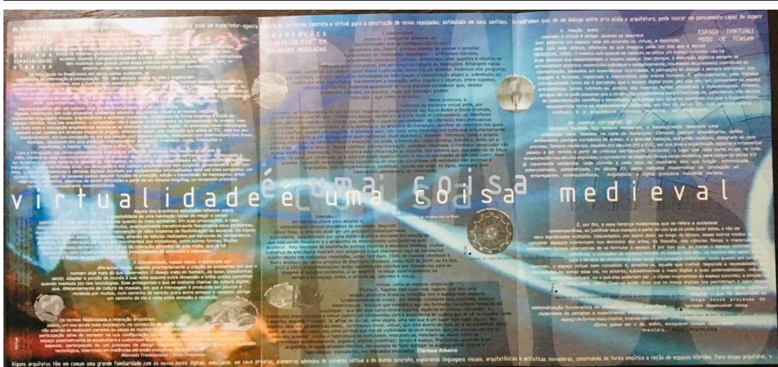
Fig 1 Revista V!rus 1, impressa, frente, foto: Anja Pratschke, 2019.