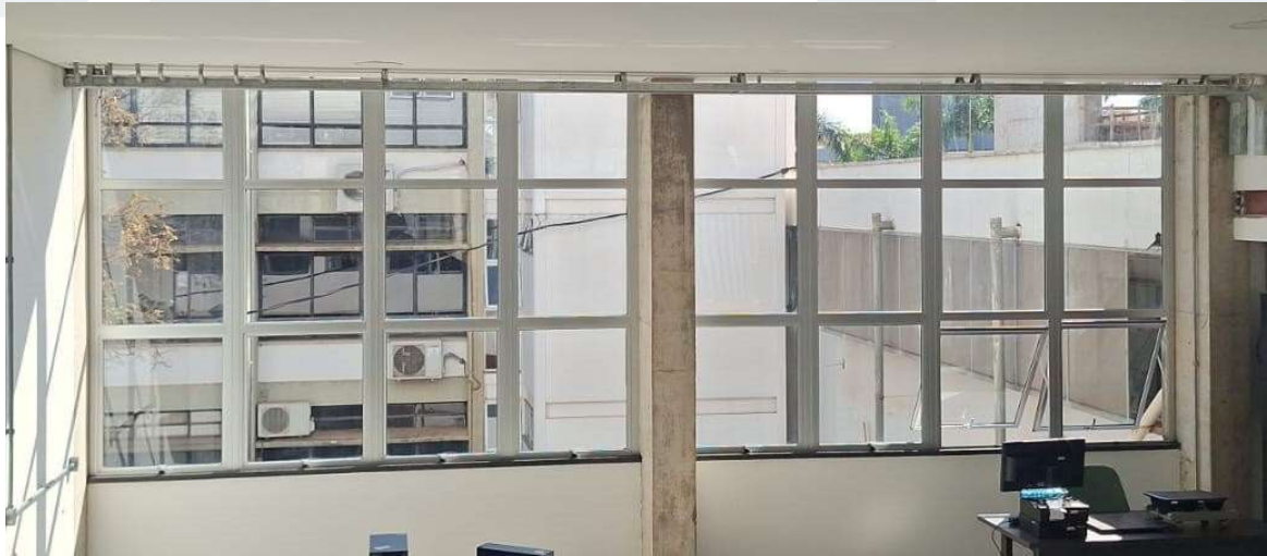
Figura 3. Janelas da Biblioteca