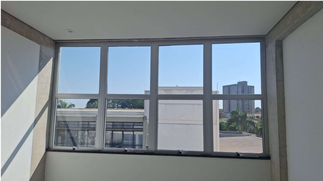
Figura 5. Janela do Laboratório de Desenho Digital