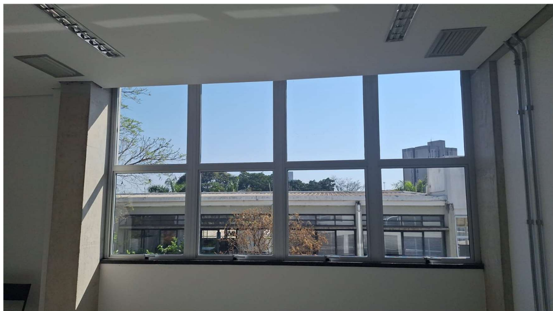
Figura 4. Janela da Seção de Informática