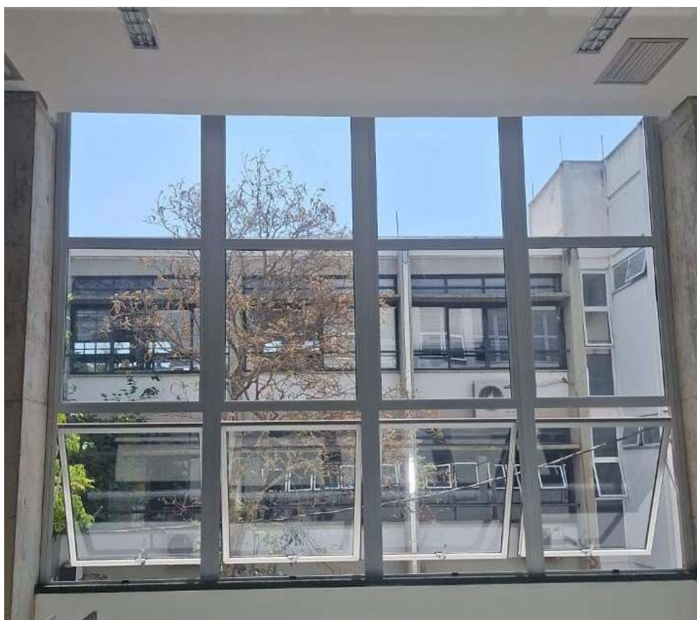
Figura 2. Janela da Biblioteca

Todas as partes metálicas aparentes, incluindo suportes, cantoneiras, trilhos e demais componentes, deverão ter acabamento em bege, com pintura resistente à oxidação e desgaste.