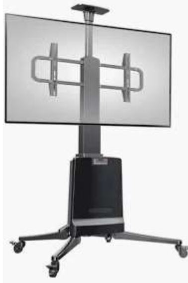
Figura 1. Foto meramente ilustrativa.